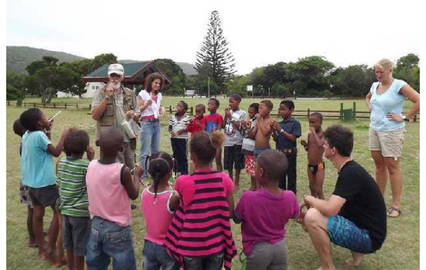
Uitleg van een spelletje

Met de kinderen van 7, 8 en 9 jaar zijn we naar Leisure Island geweest, dat is in Knysna waar we een Bijbelverhaal hebben uitgebeeld, lekker hebben gezwommen, spelletjes gedaan en natuurlijk wat lekkers gegeten.