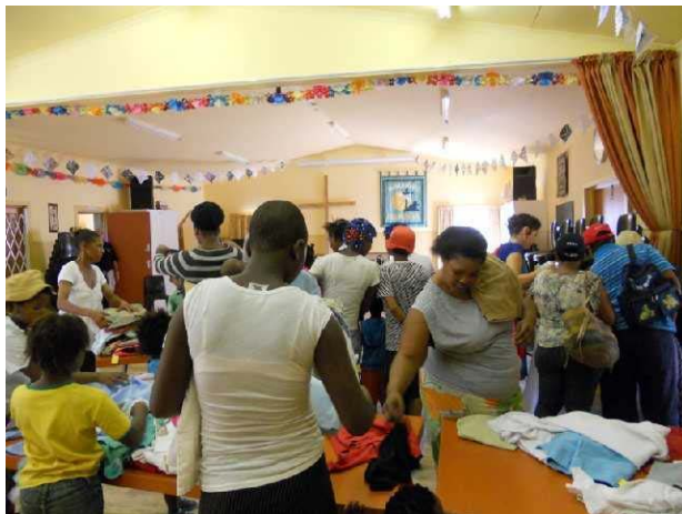
Kleding op afspraak op donderdagmiddag

Het kledingproject dat we wekelijks in het gebouw in Oupad houden is een waar succes. De mensen moeten van tevoren een afspraak bij ons maken en dan kunnen ze op donderdagmiddag komen en kleding uitzoeken, en als we schoenen hebben, ook een paar schoenen.