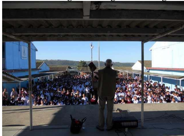
Frans: weekopening voor 1640 leerlingen

De Heer heeft ook weer zomaar uit de blue een nieuwe deur voor ons geopend . We mogen nu op een school van 1640 leerlingen in Hornlee regelmatig een weekopening komen verzorgen. Het is een grote uitdaging om hier het evangelie te mogen verkondigen.