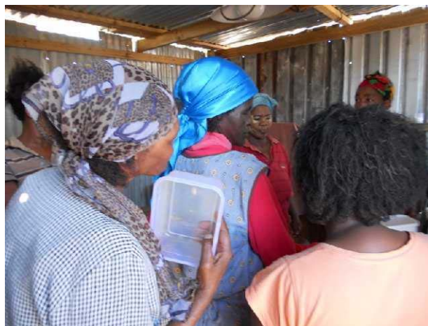
Voedselprogramma voor zieken en bejaarden

Het voedselprogramma in het Damse Bos is voor mensen die ernstig ziek zijn , zoals mensen die AIDS, TB of kanker hebben en voor bejaarde mensen. De mensen komen met hun bakje om het daar te vullen en eten het later thuis op.