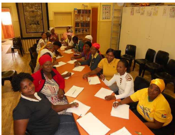
Home Base Care cursus in gebouw Oupad

Er is alweer een heleboel gebeurd de laatste maanden. Zo zijn we bijvoorbeeld met nog een cursus gestart, nl. met een Home Base Care cursus . Waarin de leerlingen worden opgeleid om in de verzorging te gaan helpen, zowel als in hun eigen woonomgeving waar veel ernstige zieken mensen zijn (AIDS, TB), alsook in verzorgingstehuizen om daar te gaan helpen. Met de kans dat daar dan een betaalde baan uit kan gaan voortvloeien. Ze krijgen na afloop een officieel certificaat.