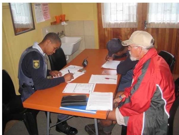
Procesverbaal voor de inbraak in het gebouw

Uit het sleutelkastje de sleutel gevonden naar het grote kantoor en daar de kasten opengebroken en de laptop eruit gehaald met wat andere dingen. Toen Frans eraan kwam stond de grote computer en beeldscherm buiten in het zand . Ze waren waarschijnlijk met het verlaten van het pand door iemand gezien en konden deze gelukkig niet zo vlug meer meenemen. Het duurde wel een uur voordat de politie kwam en daarna nog eens uren wachten en niets aanraken voordat er iemand uit George kwam (plaats 60 km verderop), die vingervormen kwam nemen.