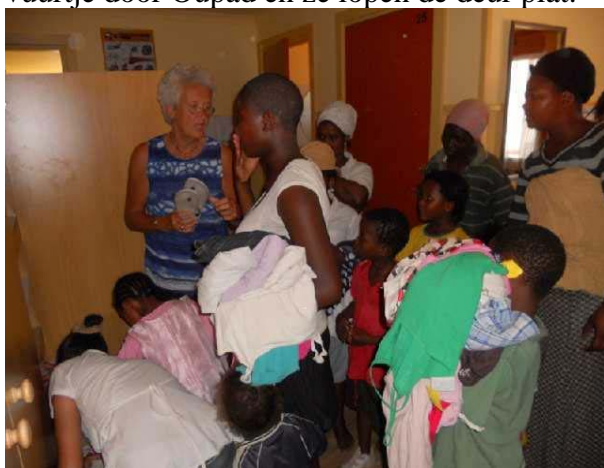
Het uitreiken en passen van de schoenen

Ook hebben we deze maand veel kleren en schoenen gekregen van een plaatselijke Baptistenkerk die een actie voor de mensen van Oupad had gehouden. Daar waren de mensen heel dankbaar voor, speciaal voor de schoenen . Dat is nl. roversgoed, ze ruiken op een afstand wanneer we schoenen hebben gekregen en dat gaat dan als een lopend vuurtje door Oupad en ze lopen de deur plat.