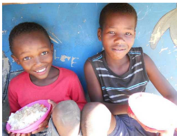
De kinderen in Nekkies eten buiten

We hebben er nog een voedselprogramma bij gekregen, nl. in de wijk South Concordia . We hebben nu vier voedingsprogramma's in Knysna lopen. De grootste is nog altijd die we zelf in ons gebouw in Oupad houden; daar komen zowel kinderen als volwassenen. Daarnaast sponsoren we een voedselprogramma in de wijk Nekkies , hier komen hoofdzakelijk kinderen.